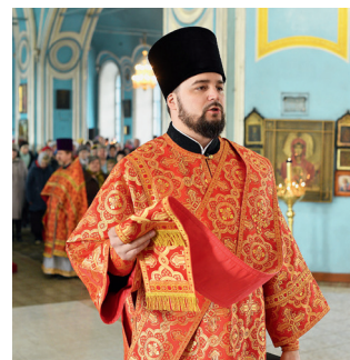
Диакон с двойным орарем