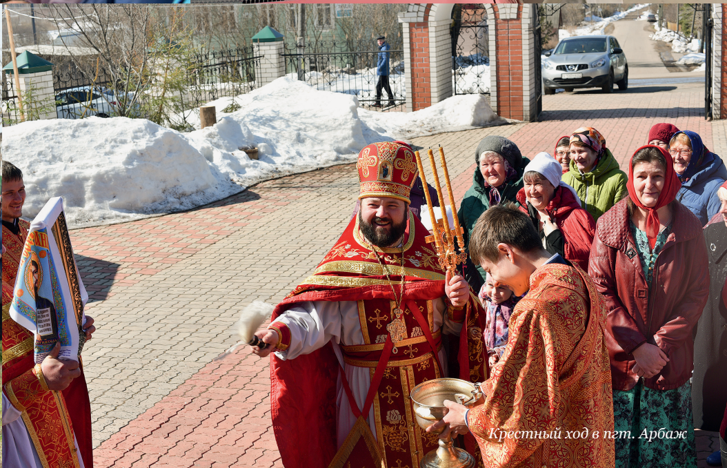
Крестный ход в пгт. Арбаж