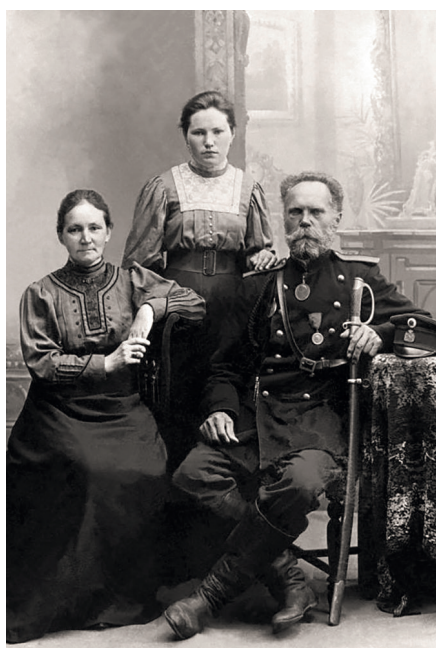
Мученица Нина с родителями

По молитвам блаженной Нины собор в Лальске долго не закрывался, хотя власти не раз предпринимали шаги к прекращению в нем богослужения. Наконец в начале 1930-х годов они все же распорядились закрыть собор, но блаженная стала писать в Москву решительные письма, собрала и отправила ходяков и действовала столь твердо и неотступно, что властям пришлось уступить и вернуть собор православным.