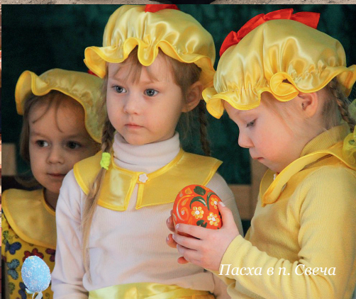
Пасха в п. Свезда