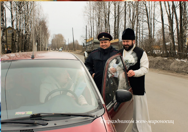
С праздником жен-мироносиц