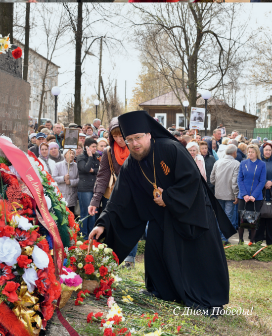
С Днем Победы!