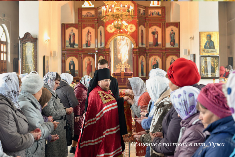
Общенье с паствой в пгт. Туруж