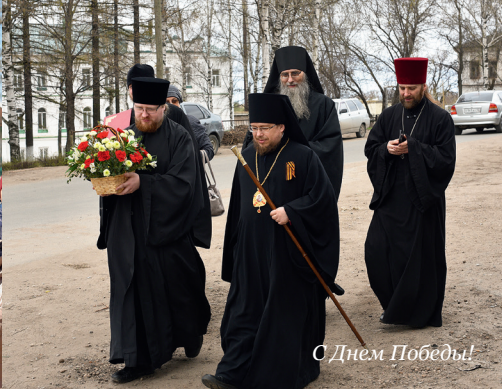
С Днем Победы!