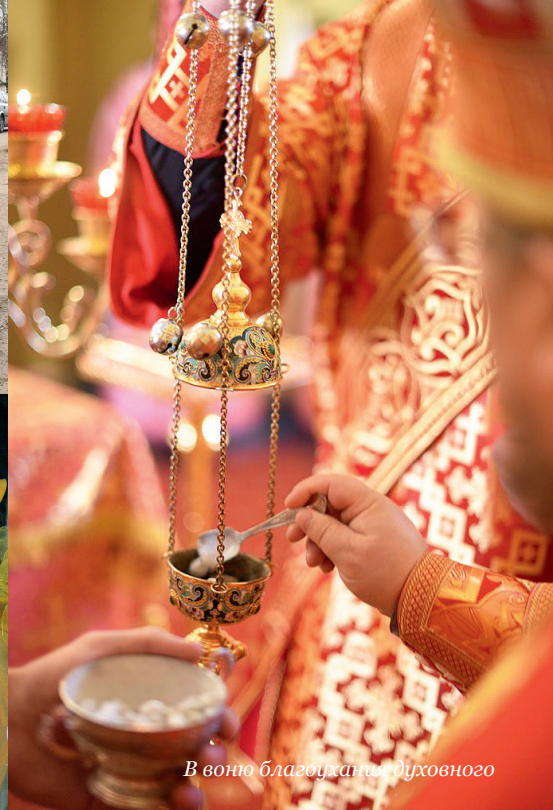
В воюю благодуханья духовного